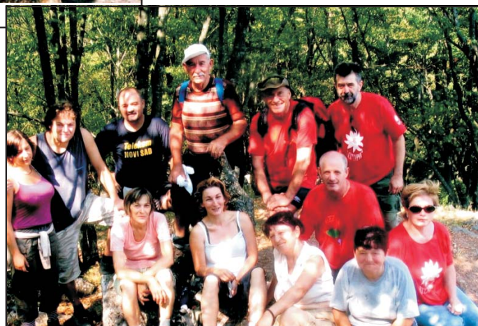
Овчар 28. јула 2007.

Мора се напоменути да су вође пута савесно вршиле своју одговорну дужност и да