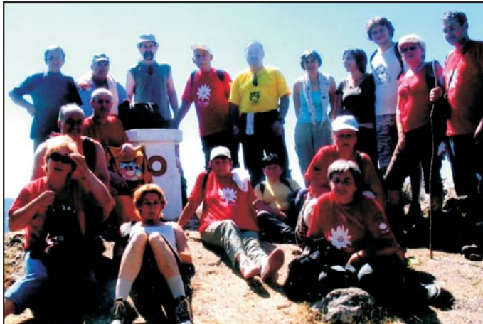
Каблар 28. јула 2007.

планинара Сирига. Истовремено сагледане су историјске и природне вредности овог подручја Ђердапа и