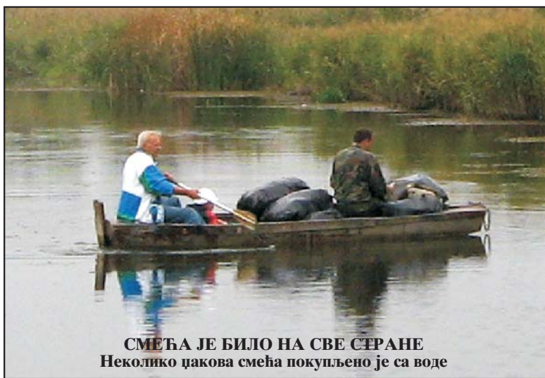
СМЕЂА ЈЕ БИЛО НА СВЕ СТРАНЕ Неколико џакова смеђа покупљено је са воде

жили туристичко-културној манифестацији "Дани европске баштине" која је заједничка акција Савета Европе и Европске комисије на тему "Реке, путеви, наслеђа".