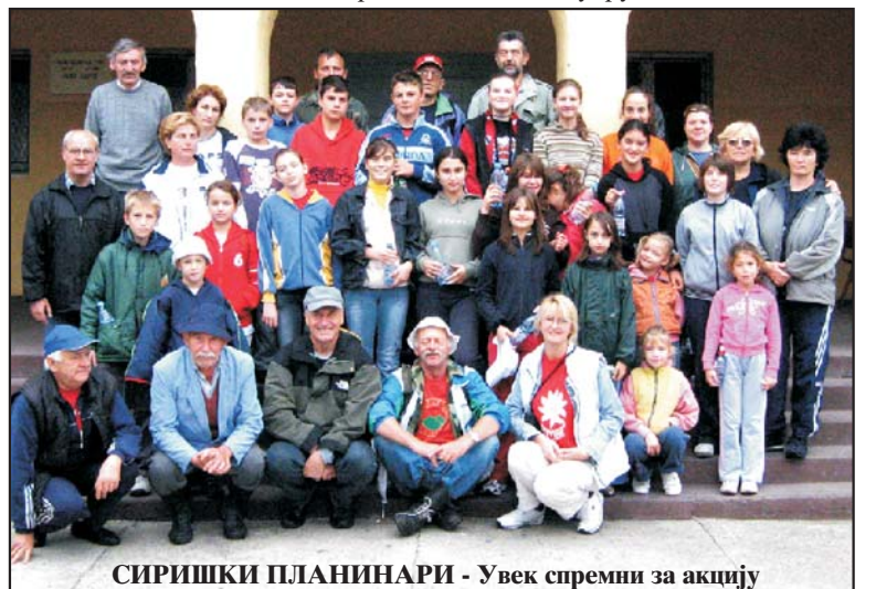
СИРИШКИ ПЛАНИНАРИ - Увек спремни за акцију

самој Јегричкој. На овом еколошком задатку нисмо били сами, непосредно су нам помогла два разреда Основне школе "Данило Зеленовић" из Сирига, као и чланови сиришког ловачког удружења. Задовољни