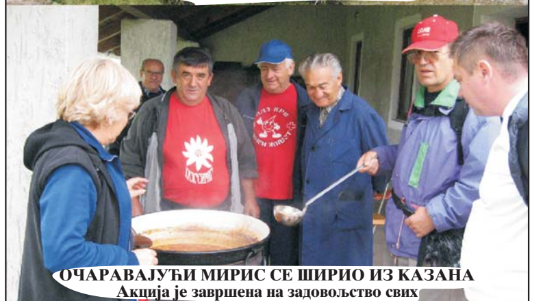
ОЧАРАВАЈУЋИ МИРИС СЕ ШИРИО ИЗ КАЗАНА Акција је завршена на задовољство свих