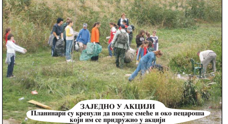
ЗАЈЕДНО У АКЦИЈИ Планинари су кренули да покупе смеће и око пецароша који им се придружио у акцији