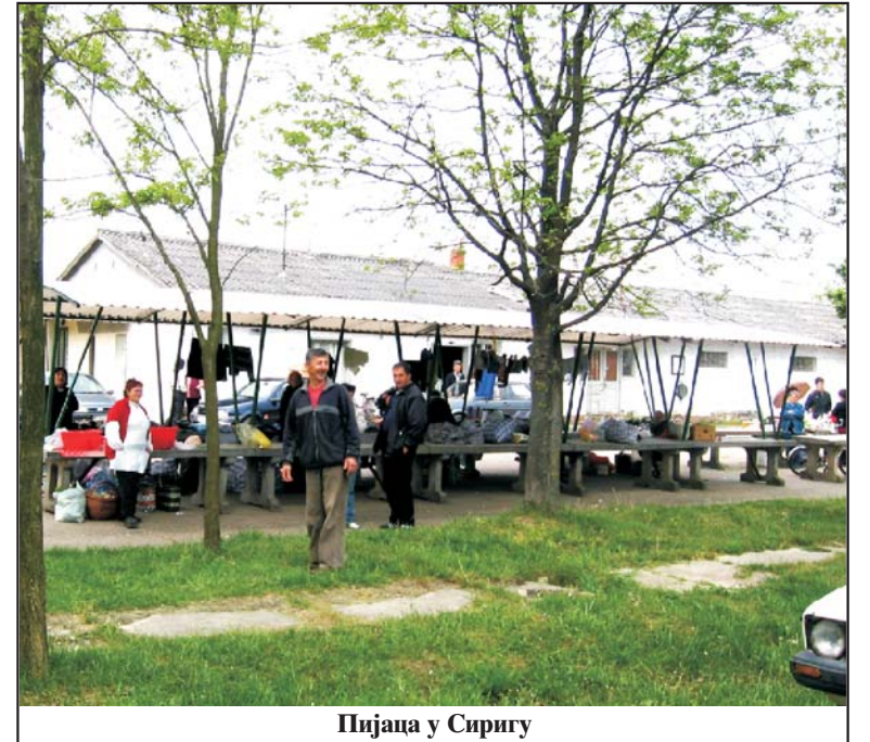
Пијаца у Сиригу