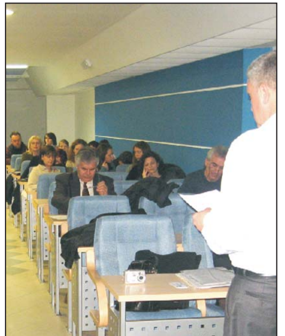
ницима Морахалома, а узвратна посета делегације привредника из Мађарске биће организована за време Сајма предузетника -С.Ј.

У оквиру овог пројекта организована је званична посета привредника Темерина привред-