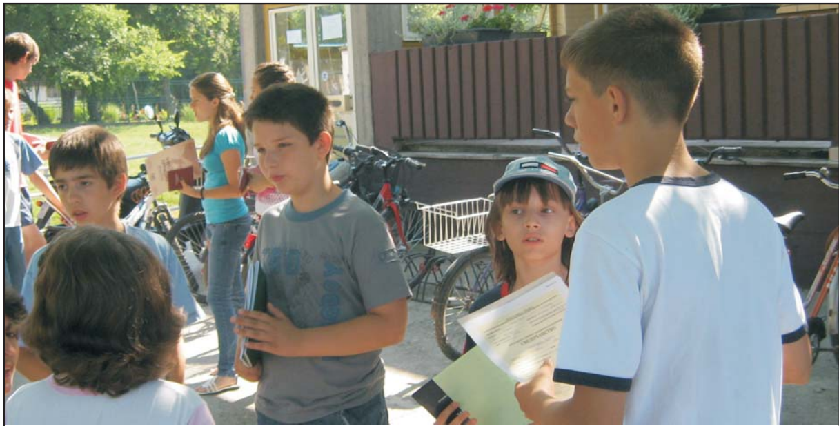
Последње звоно у овој школској години обрало је све ученике

У трећем степену у средњој школи у Темерину