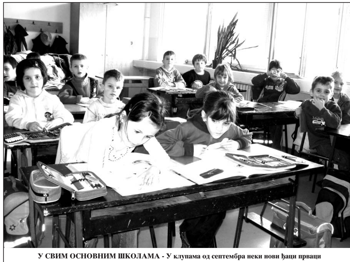
У СВИМ ОСНОВНИМ ШКОЛАМА - У клупама од септембра неки нови ђаци прваци

дардних докумената, потребно је приложити уверење о завршеном припремном предшколском програму такозваном нултом разреду. Упис деце вршиће се у свим школама нормално од почетка априла с тим да ће дете бити уписано у први разред тек када се